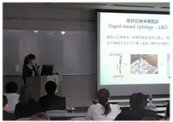
「甲状腺LBC標本の特徴と見方」 隈病院 鈴木 彩葉 技師