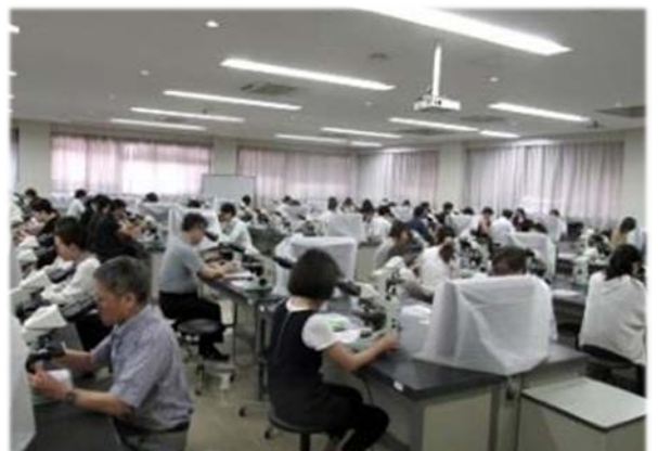
甲状腺細胞診の鏡検実習