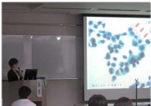
スライドセミナー解説